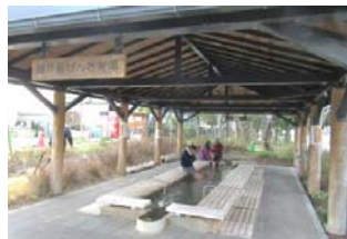
潮芦屋げんき足湯