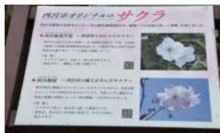
西宮市オリジナル桜の説明板